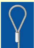
Câble avec boucle sertie pour gonds et crochets muraux

Ces accessoires sont des câbles munis d'une terminaison adaptée à l'usage requis (longueur 30 cm environ, \varnothing 1 à 1,8 mm).