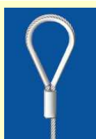
Câble à boucle + cosse pour gonds et crochets (charges lourdes)