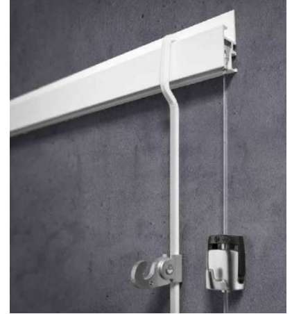
Rail R30 – 35 × 11,7 mm, charge jusqu'à 50 kg.

Recommandés pour locaux d'accueil et salles d'expo avec rotations fréquentes des objets