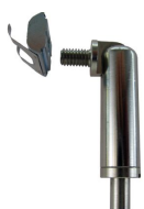
Coulisseau automatique articulé universel