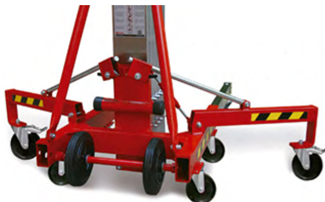
Roulettes incluses pour manoeuvre verticale et horizontale facilitée