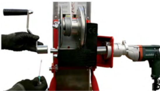
Système de levage électrique (capacité de charge plafonnée à 350 kg sur la gamme D avec cette option)