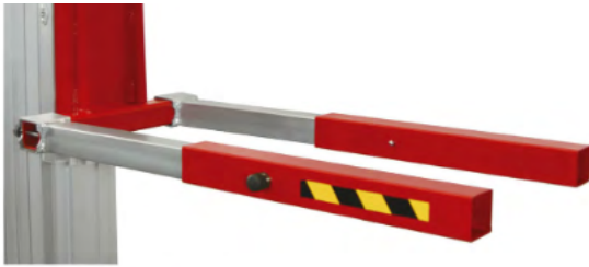
Prolongateurs de fourche