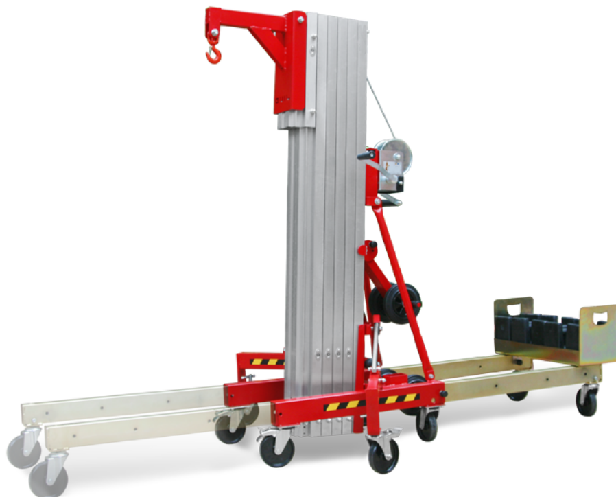
Illustration : grue Transformer avec 5 contrepoids de 20 kg et accessoire potence à crochet