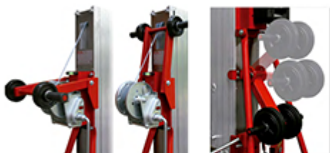
Poignée de manoeuvre (ajustable 3 positions sur modèles C & D)