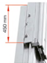
Recouvrement entre section de mâts importants : 450 mm