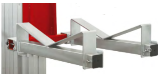
Adaptateur spécial formes rondes