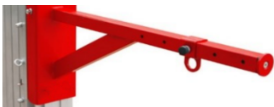
Perche (peut être livrée de série sans supplément à la place de la fourche)