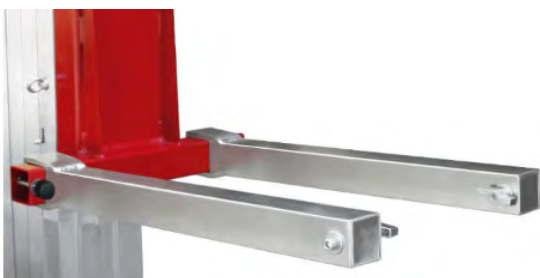
Fourche (livrée de série)