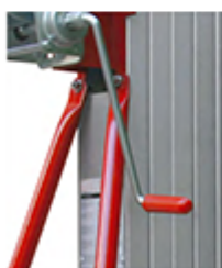
2 raidisseurs obliques pour une meilleure stabilité