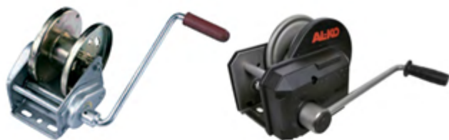
Treuil auto-freinant selon la directive machine CE