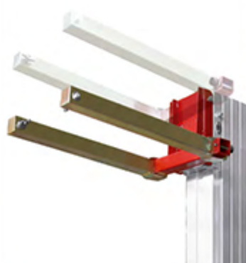
Fourches renforcées incluses, démontables et réversibles