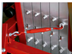
Tendeur de blocage des mâts pour déplacement couché