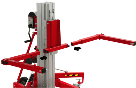
Élargisseur de fourche