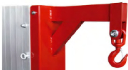
Potence à crochet (peut être livrée de série sans supplément à la place de la fourche)